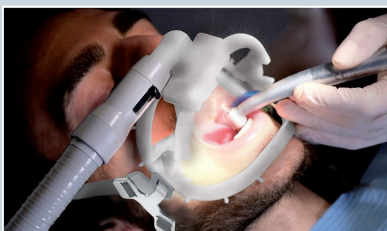
с включен WS Aerosol Defender

CEFLA разработиха устройството WA Aerosol Defender, което ограничава риска от вдишване на аерозоли от лекаря - издишания въздух от пациента, капчици слюнка и спрей от инструментите, получаващи се по време на стоматологичното лечение. Преимуществото на това устройство е, че зъболекарите могат да работят с повече сигурност за здравето си.