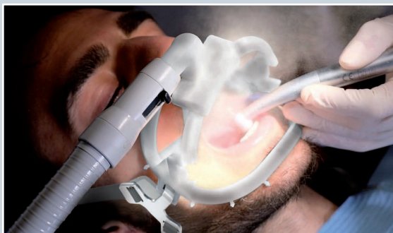
с изключен WS Aerosol Defender